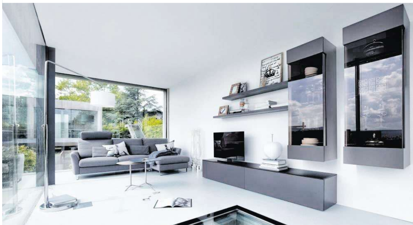
CONTUR Wohnwand 5800, Breite 300 cm, Lack Tufo matt, Glas Bronzato transparent für nur 1.998 statt 2.998 Euro

Prozente. Traumeinrichtung zum Schnäppchenpreis: Ab sofort beginnt der Sommerschlussverkauf bei SUMMA!