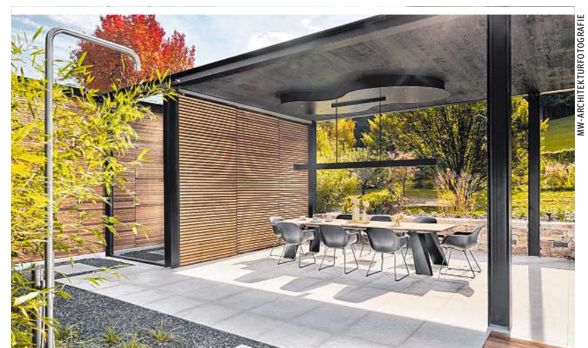
Auch ein komplettes Outdoor-Esszimmer wurde eingerichtet