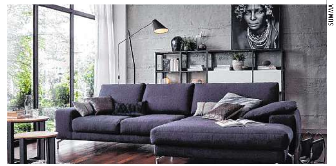
GLOBAL Garnitur Solento für nur 1.980 statt 2.941 Euro