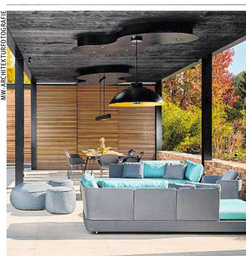
Große geschützte Sitzflächen zum Relaxen