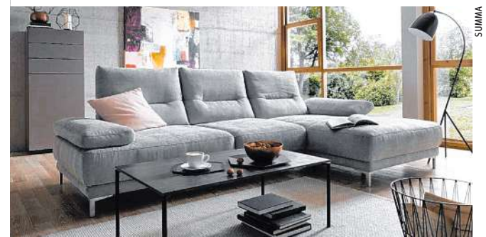
GLOBAL Garnitur Malaga für nur 1.798 statt 2.549 Euro

Heuer war bisher noch keine gute Zeit für Möbelkäufer – lange waren die Geschäfte wegen des Lockdowns geschlossen. Aber dafür beginnt der Sommerschlussverkauf in diesem Jahr früher und dauert länger denn je. Ab sofort warten im Rahmen des Sommerschlussverkaufs bei SUMMA jede Menge Einrichtungsangebote aus allen Wohnbereichen.