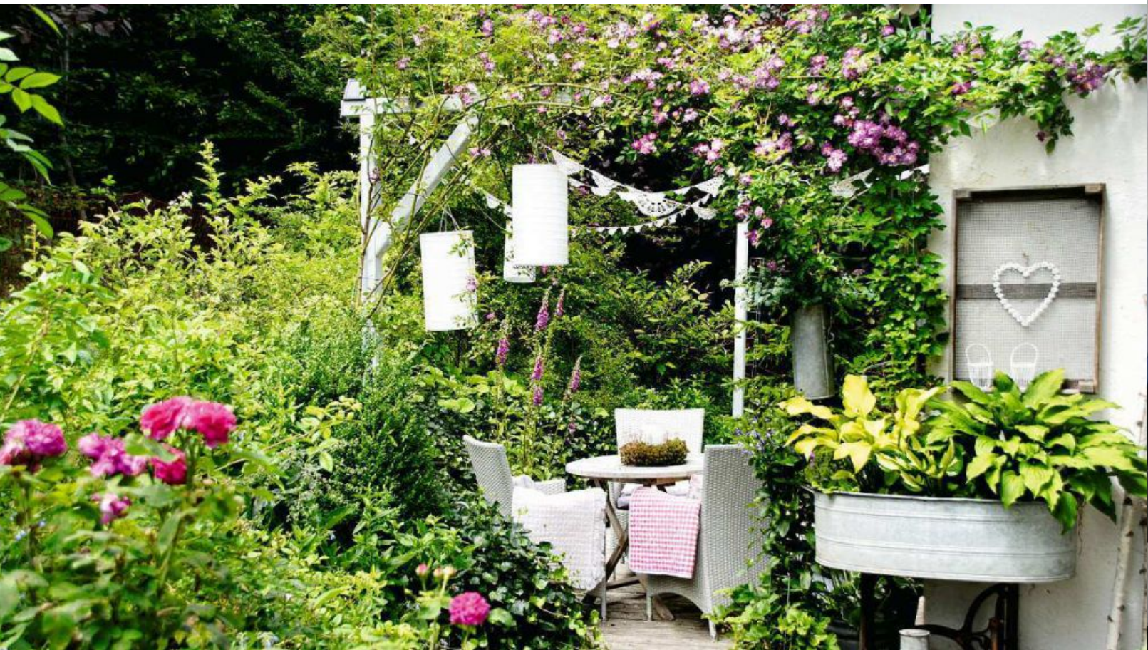
Für besonders viel Gemütlichkeit sorgen spezielle Details wie Lichterketten, Lampen, Decken und Co.

oder Zäune erfolgreich ersetzen. Ist ein Zaun oder eine Mauer bereits vorhanden, kann dies auch zum Vorteil genutzt werden. Um ihre massive Wirkung abzuschwächen, lassen sich Rankpflanzen, wie Efeu, einsetzen. Oder man bedient sich dem Trend des vertikalen Gartens, also Pflanzen, die nicht ebenerdig, sondern an der Wand gepflanzt werden. Eventuell ist sogar ein Baum im Garten vorhanden. Er dient als perfekter Sonnenschutz und Platz für Sitzcken. Für