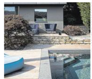
Die Terrasse wurden durch den Pool ergänzt