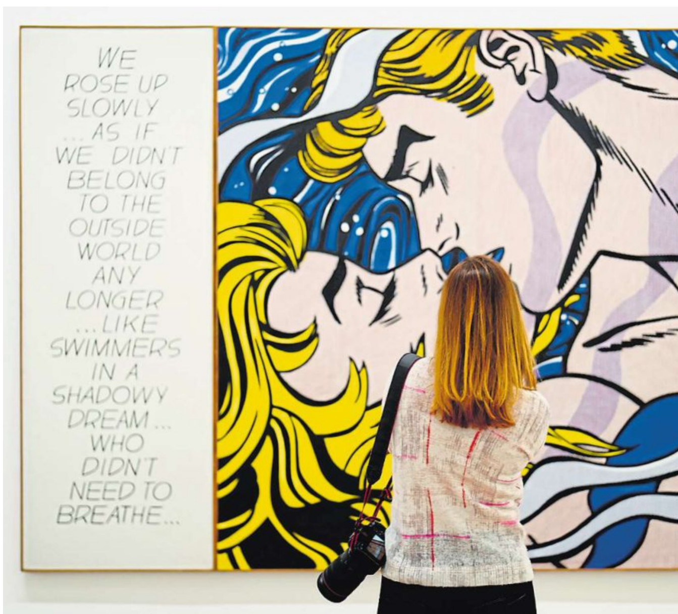
Das Bild „Wir standen langsam auf“ in der Albertina-Ausstellung, die ab morgen (Freitag) zu sehen ist