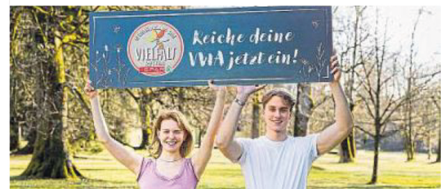
Die VWAs können ab sofort eingereicht werden

spar.at/nachhaltigkeit/produkte/vielfalt/vielfaltspreis