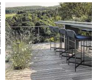
Lieblingsplatz mit herrlichem Blick