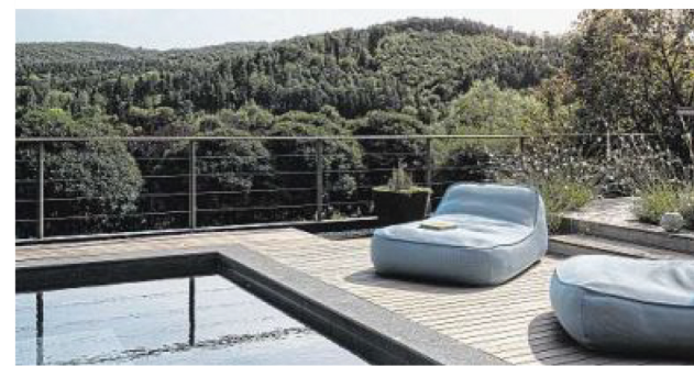
Einladende Möbel sorgen für lange Mußbestunden

All jene, die sowohl einen A1 Internet Tarif als auch einen A1 Smartphone-Tarif nutzen, sparen beim Smartphone-Tarif 5 Euro/Monat – und profitieren darüber hinaus auch von bis zu 10GB zusätzlichem Datenvolumen pro Monat. Weiters steht ihnen durch Nutzung von Connect Plus auch die Möglichkeit offen, den Mobiltarif A1 Simply Family 5G zu aktivieren: um 14,90 Euro/Monat gibt es 40GB Datenvolumen im A1 5G Netz und 2.000 Minuten/SMS – der erste Monat ist gratis. A1.net