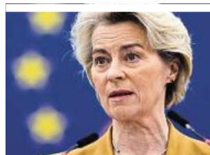
EU-Kommissionspräsidentin Ursula von der Leyen

Laut ÖVP-Generalsekretär Christian Stocker gebe es „einige rote Linien“, die die Volkspartei nicht mittragen