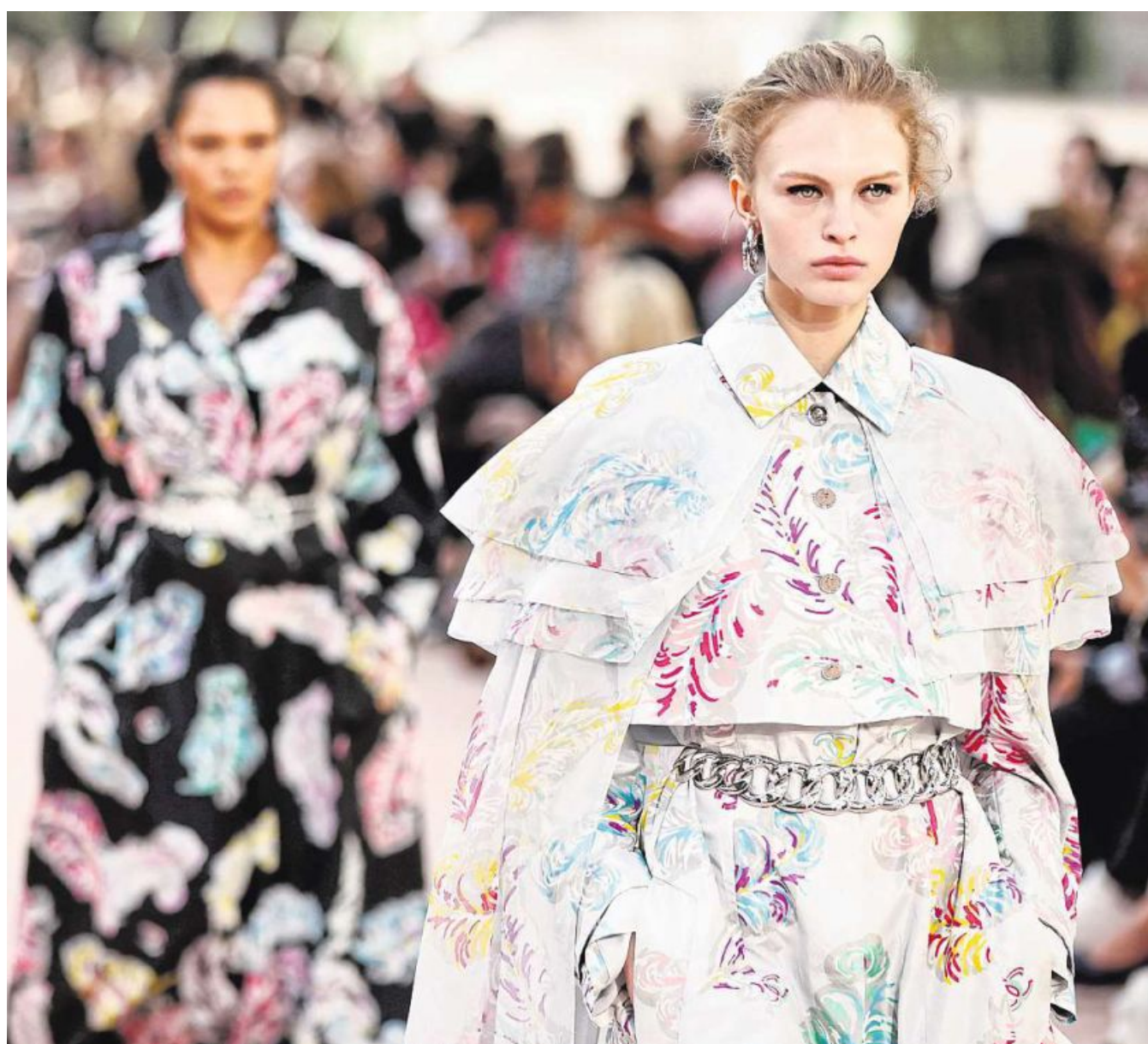
Aktuelle Kollektion von Chanel für den Sommer 2025. Chefdesignerin Virginie Viard hat das Haus nach fünf Jahren verlassen